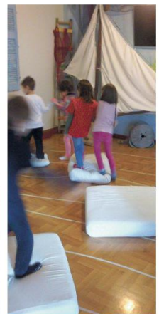
Τα παιδιά ηθδούν με προσοχή από νησί σε νησί, αν κάποιος μείνει χωρίς το ζευγάρι του... οι καρχαρίες ξυπνούν....