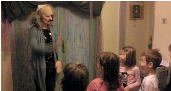
Μάγος που δίνει τους χρησμούς