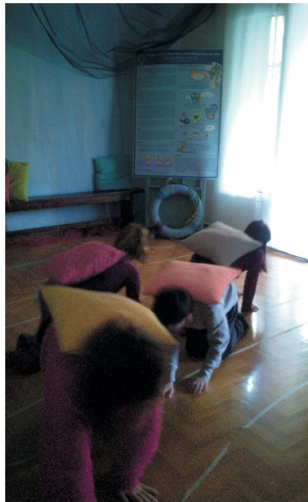
Μονοπάτι μόνο για χελωνάκια