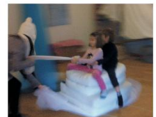
Διαδρομή με τον ιερό ελέφαντα...